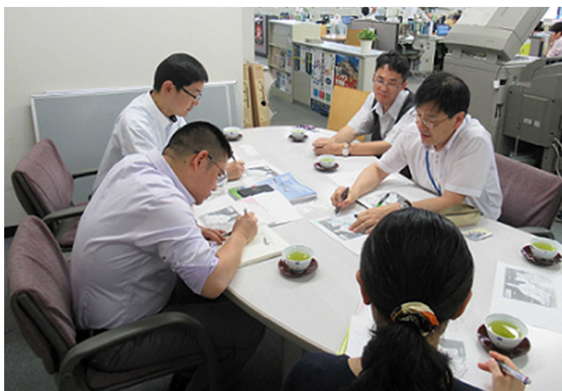
(2018年、中長期調査員が静岡産業振興財団にてヒアリング調査)

2019年までに41人を受入れ、日本の中小企業の発展やイノベーション・環境問題への取組み、地方自治体の財政管理等、それぞれのテーマに基づき、20日～3か月間の調査を行い、浙江省及び中国の経済発展に寄与している。