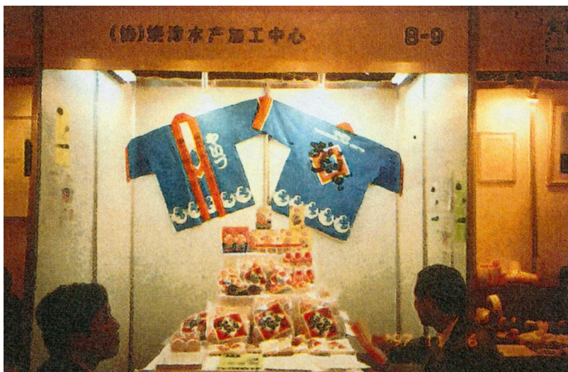
(静岡県からの企業出展の様様)