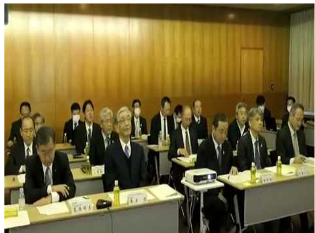
(静岡県・浙江省経済交流促進機構第31回会議 (オンライン))