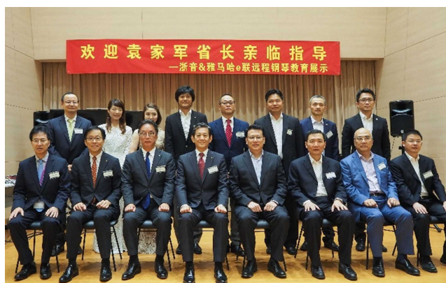
2018年8月27日、浙江省省长袁家军一行与雅马哈株式会社社长田中幸也以及集团相关人员雅马哈公司内演奏厅合影留念。