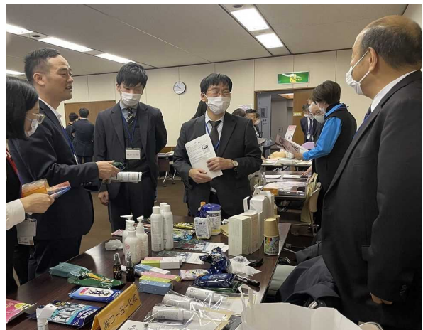
(静岡県浙江省経済交流シンポジウム 静岡県・浙江省(義烏市)化粧品ビジネス交流会)