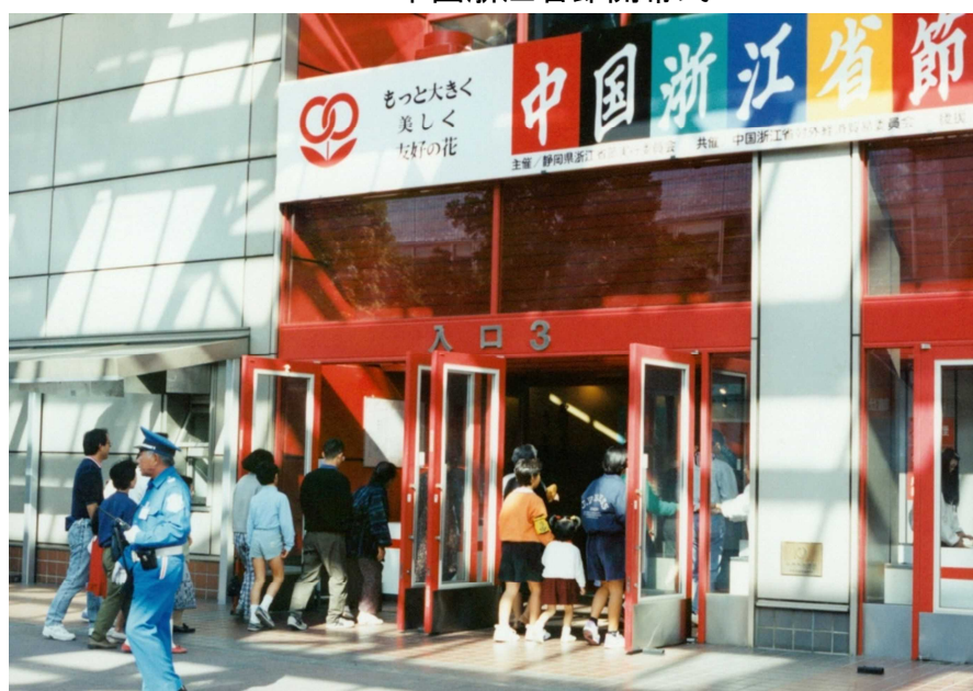
中国浙江省節会場入り口