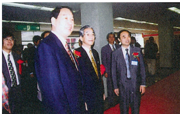
(商談会会場内にて)