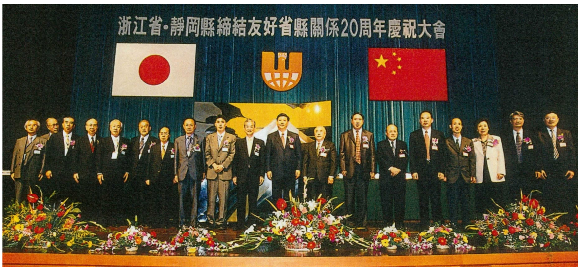
(杭州での友好提携 20 周年記念式典)