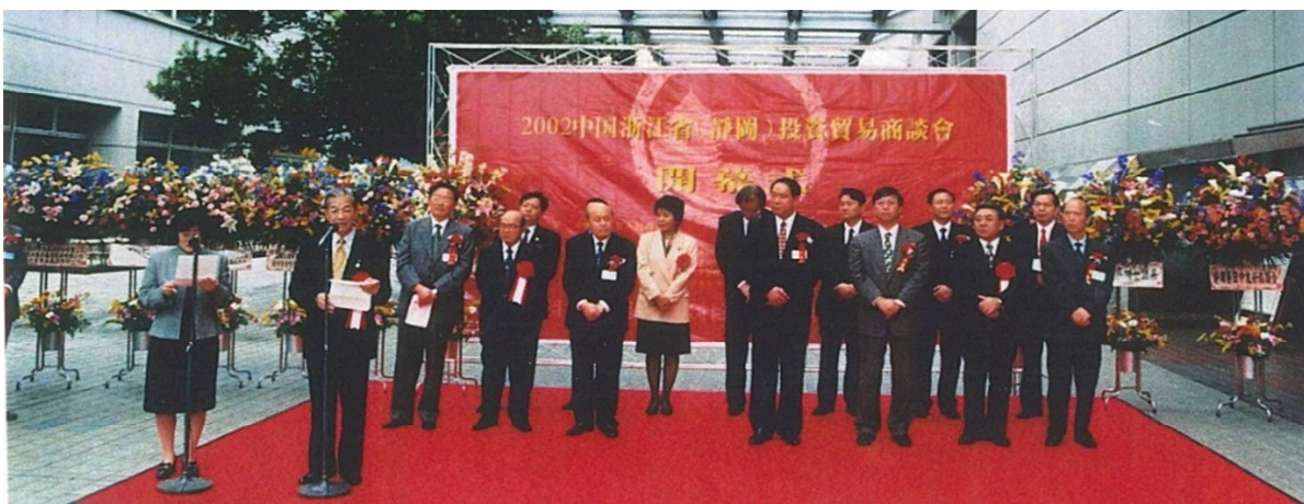
(浙江省投資貿易商談会開幕式)