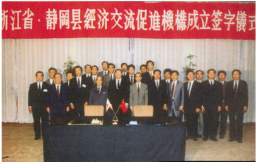
(浙江省万学遠省長立ち合いの下、静岡県・浙江省経済交流促進機構設立調印式を行った)