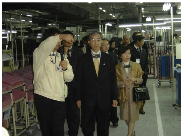
(2004年、石川嘉延知事蕭山ヤマハ視察)

現在の計画では、今後も継続的に新たな投資を行っていく予定である。(年間約1億人民元(約19億4,700万円)を予定)