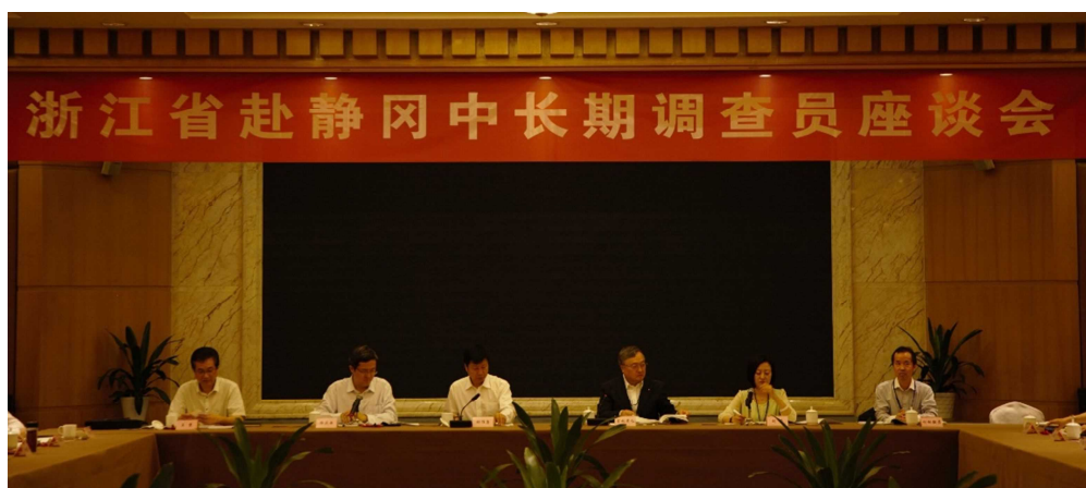
(浙江省中長期調査員交流会)