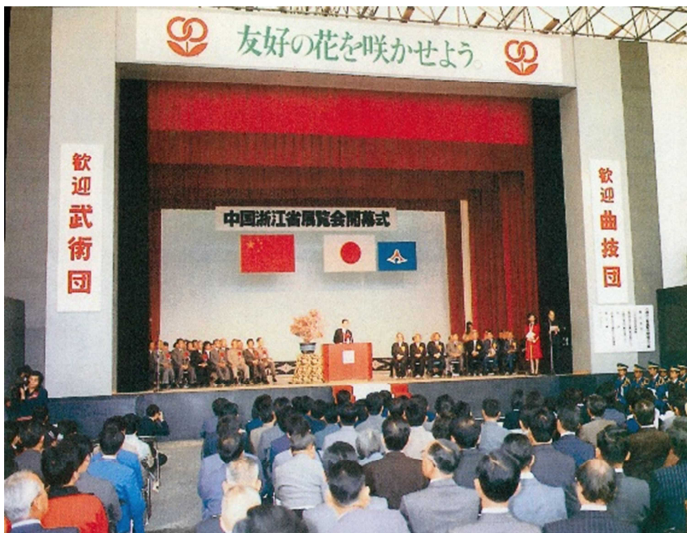
(浙江省展覧会開幕式)

1978年に日中平和友好条約が締結されてから、日本の地方自治体では、積極的に中国の地方政府と友好交流を展開し、1982年4月20日には、静岡県と浙江省とが県省友好提携を締結し、同年10月26日には、双方が杭州にて、『静岡県・浙江省経済技術及び文化交流についての覚書』を締結した。その後、行政・議会・メディアや民間での相互訪問が頻繁に行われるようになり、文化・経済・教育・衛生・スポーツ・農林水産等幅広い分野での交流と協力が展開されるようになった。