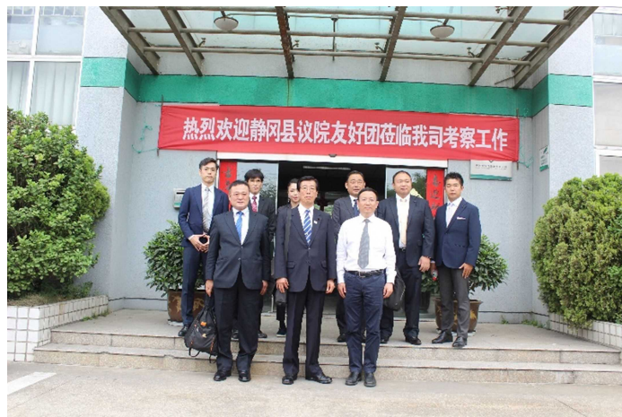
(2018年、静岡県議会浙江省友好訪問代表团一行来訪)