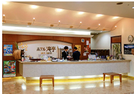
(ホテル滝亭フロント)