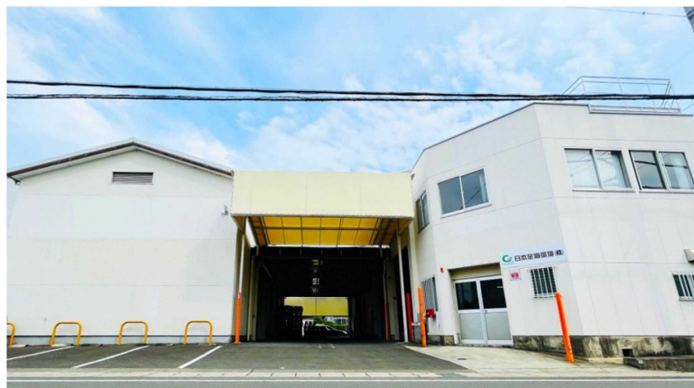
(日本金海環境株式会社静岡関東事務所)