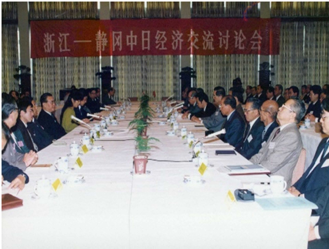
(第5回静岡県・浙江省経済交流シンポジウム)