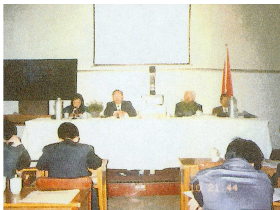
(浙江省での企業管理講座開催)

これまで、多くの専門家を浙江省の優秀な企業に派遣し、これにより、浙江省企業の経営管理レベルが向上し、競争力を高め、浙江省経済の発展の一助となった。