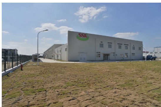
(愛食客食品(浙江)有限公司工場)

愛食客食品と平湖経済技術開発区は、互いに良好な関係を維持し、両者が共に発展する姿を目指したいと考えている。