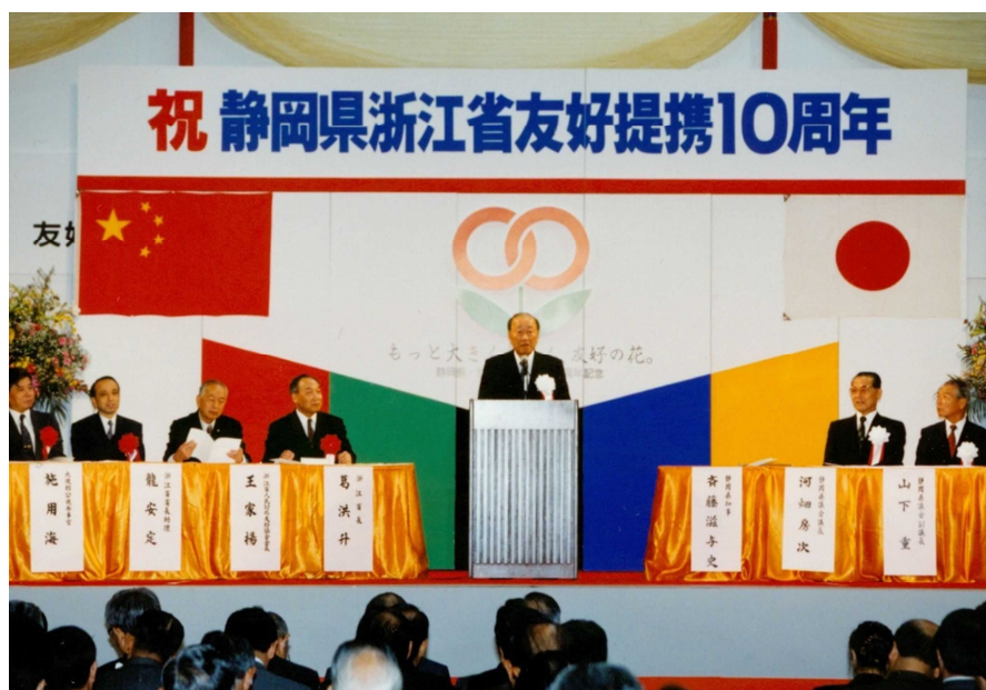
中国浙江省節開幕式

10周年記念のメイン事業として実行委員会を組織し、全県民ぐるみの事業として開催。また、浙江省對外經濟貿易委員会主催の輸出商品展示商談会を開催し、通常貿易業務相談や投資相談会を開催。