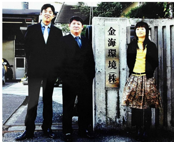
(2007年金海高科、静岡で日本金海環境株式会社を設立)

中日経済貿易関係のより一層の深化に伴い、2007年7月に、金海高科は、静岡で登録資本8,900万円で日本金海環境株式会社を設立した。静岡は、三菱・東芝・日立という重要な顧客の所在地であったため、静岡で企業を設立することは金海高科が顧客に対し、より良いサービスを提供することができることから選び、顧客のニーズをより速く満足させることができる場所である。2008年、業務範囲の持続的拡大に伴い、大阪にて関西事務所を設立し、日本での市場をより拡大することになりました。日本金海環境株式会社は設立して15年、企業及び製品のグローバル化の進展を積極的に促進し、金海高科の「海外への進出」の実現のため、強力に推進している。