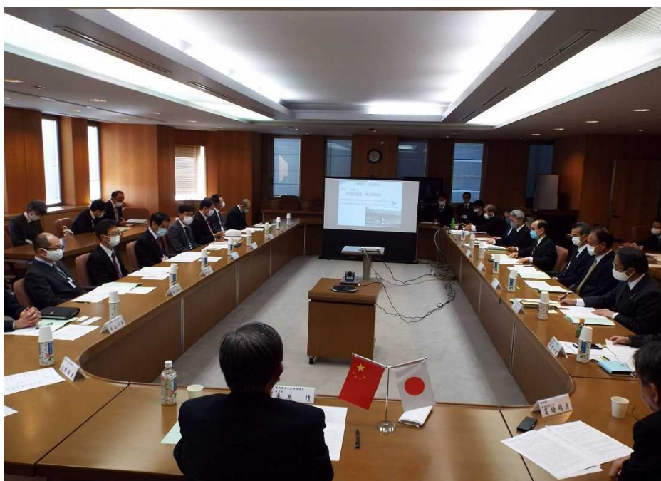
(静岡県・浙江省経済交流促進機構第29回会議 (オンライン))