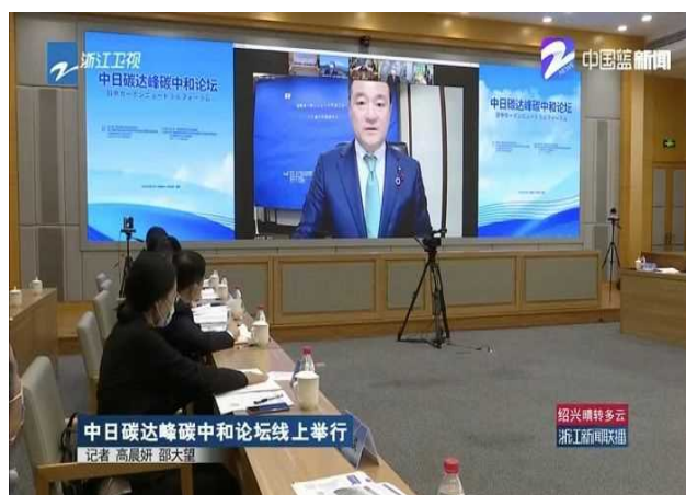
(日中カーボンニュートラルフォーラム)