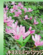
キヨスミツバツツジ