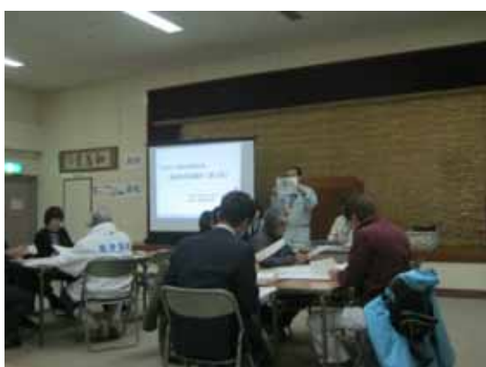
第3回地区協議会資料説明