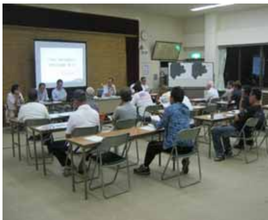
第1回地区協議会 質疑・応答風景