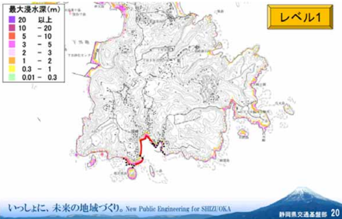
図1 須崎地区 5地震重ね合わせ（レベル1）最大浸水深図