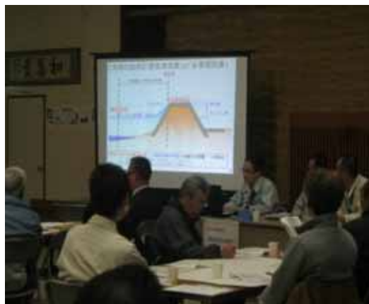
第2回地区協議会資料説明