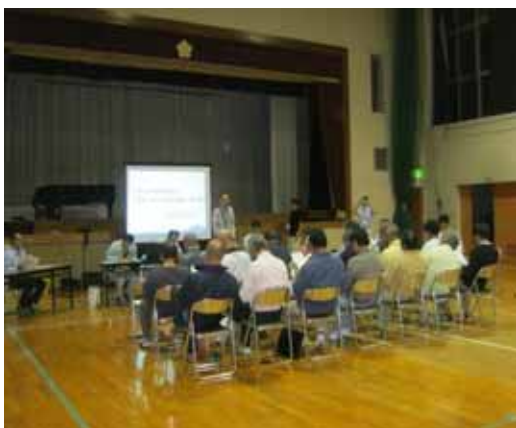
第 1 回地区協議会風景