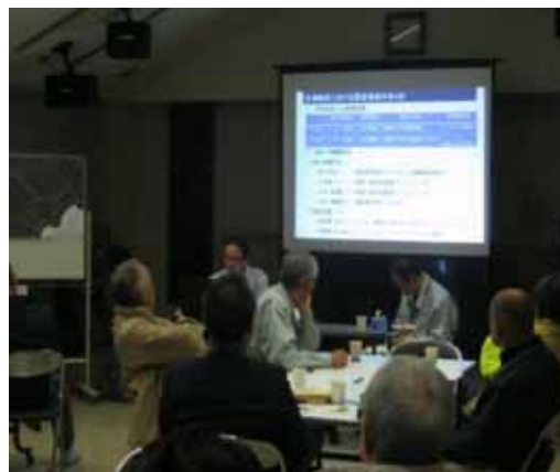
第 2 回地区協議会資料説明