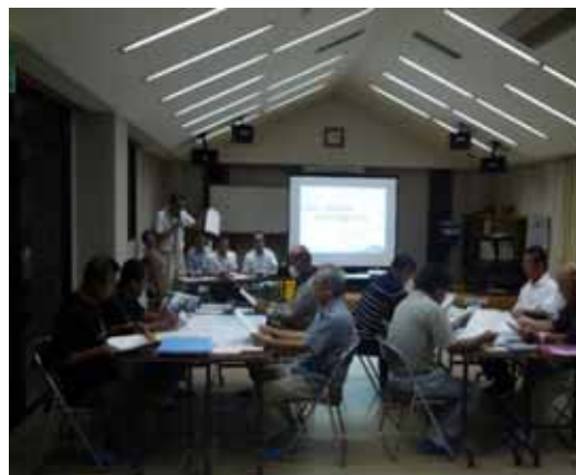
第 4 回地区協議会住民説明会報告