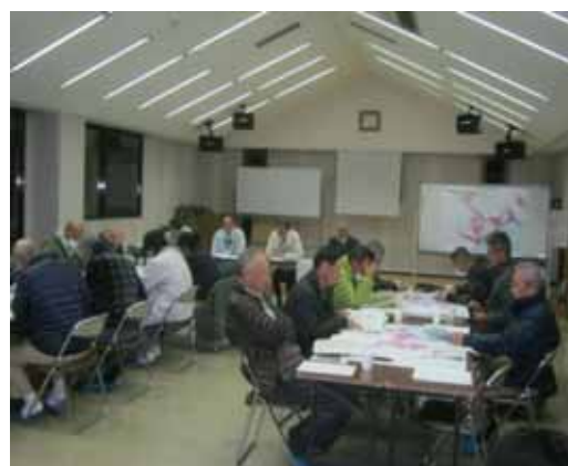
第 6 回地区協議会協議風景