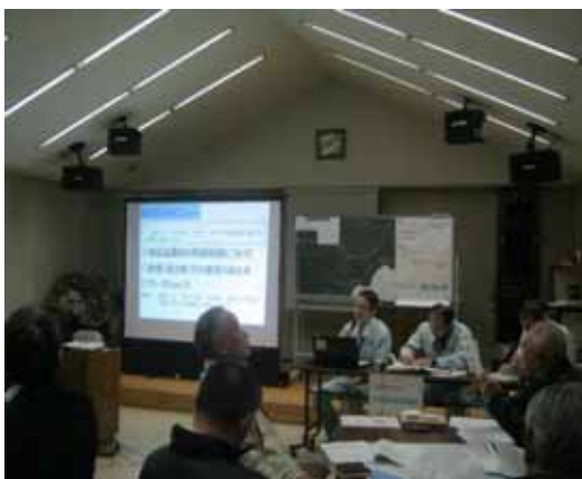
第 3 回地区協議会資料説明