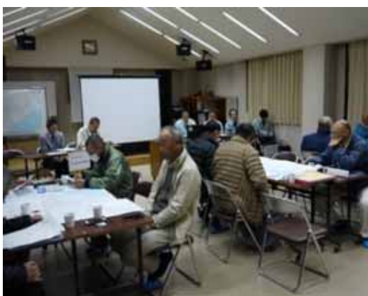
第 5 回地区協議会前回協議会のまとめ