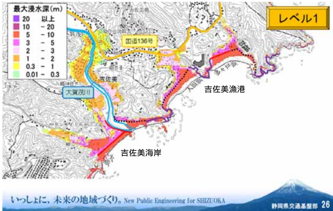
図1 吉佐美地区 5地震重ね合わせ(レベル1)最大浸水深図