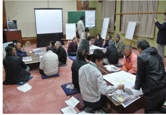
第 2 回地区協議会風景