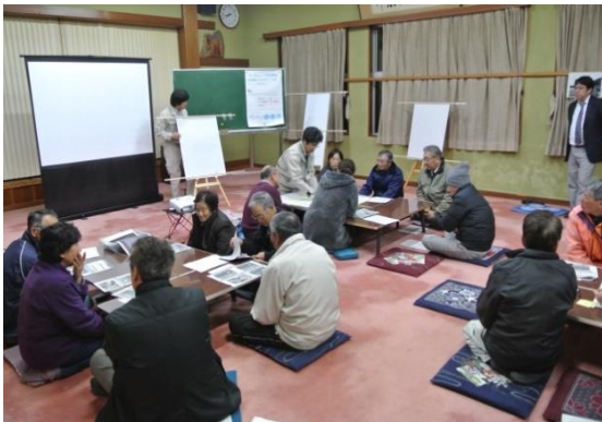
第 3 回地区協議会風景