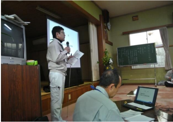
第 1 回地区協議会風景