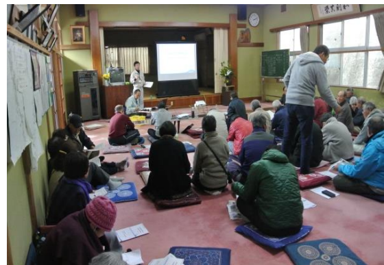
第 4 回地区協議会風景