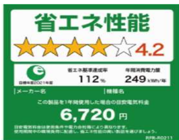
統一省エネラベル